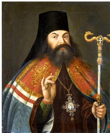
Рис.1. Портрет Феофана Прокоповича

Риторика як наука вивчає способи переконання, методи творення тексту, його структуру, способи аргументації думки тощо. Як мистецтво вона передбачає вміння добре говорити, грамотно будувати висловлювання, прикрашати мовлення. Цю особливість відображає одна з її назв – «красномовство».