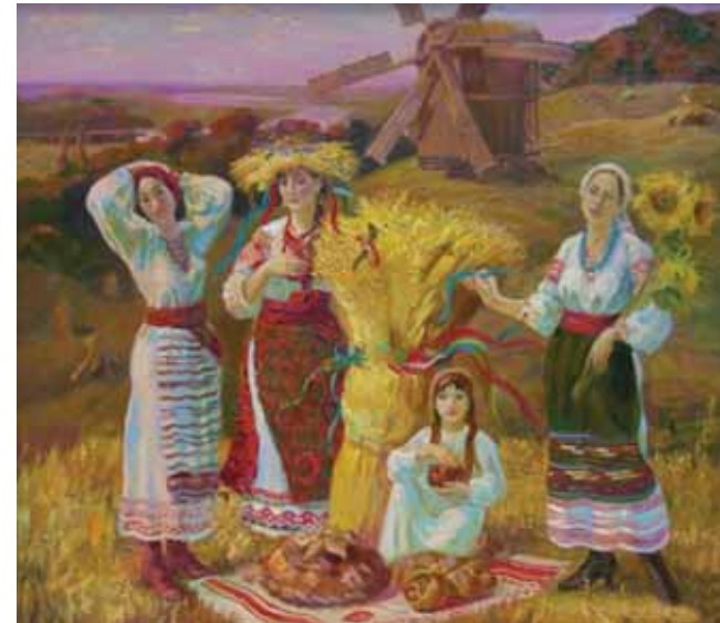
Г. Попінова. Обжинки

Який характер пісні? Про що співається в ній? Яка з репродукцій картин найкраще ілюструє пісню?