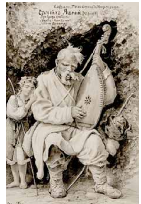
А. Сластіон. Портрет кобзаря Самійла Яшого