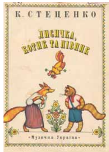
Обкладинка нот опери

В лісі зелененькому сосни та ялини. Серед них маленька згорбилась хатина. Котик-воркотик з Півником дружить: В лісовій хатині живуть і не тужать. Котик із рання і до смеркання Ходить-проводить в гаю полювання. Півник комашок під хатою ловить, Посуд помиє, їсти зготує. Ввечері разом відпочивають: Сядуть рядочком, пісню співають.