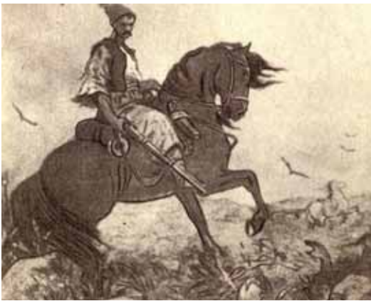
М. Дерегус. Козак Голота

Однією з найвідоміших є «Дума про козака Голоту». Хто ж це такий? Козак Голота («голота» означає «бідняк, незаможний») — це поетичний образ захисника рідної землі від іноземних загарбників. Дехто вважає, що цей персонаж має історичне підґрунтя: у ньому, начебто, змальовано одного зі сподвижників Богдана Хмельницького — полковника Іллю Голоту.