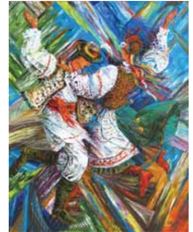
Роман і Надія Федини. Коломийка

Коломийка — це танкова пісня. Коли її співають, музиканти зазвичай пританцювують. Коломийка складається з двох рядків.