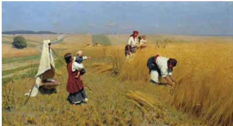
М. Пимоненко. Жнива в Україні