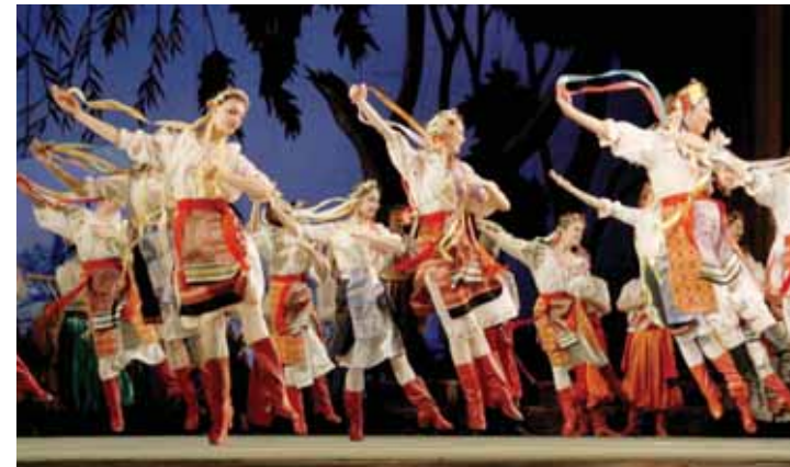
Танцювальні сцени з опери «Запорожець за Дунаєм» (Національний одеський театр опери та балету)

В опері «Запорожець за Дунаєм» видатного українського композитора Семена Гулака-Артемівського звучать п'ять танців: дівочий хорівод, «Український танок», «Чорноморський козак», «Запорозький козак», «Козачок». За сюжетом опери, хлопці й дівчата повертаються з поля — закінчилися жнива й розпочалося свято врожаю, яке неможливо уявити без танців і пісень. Усі танці, що відбуваються на сцені, — різного характеру. У музиці танців композитор намагався відобразити козацький дух, гумор, мужність і оптимізм.