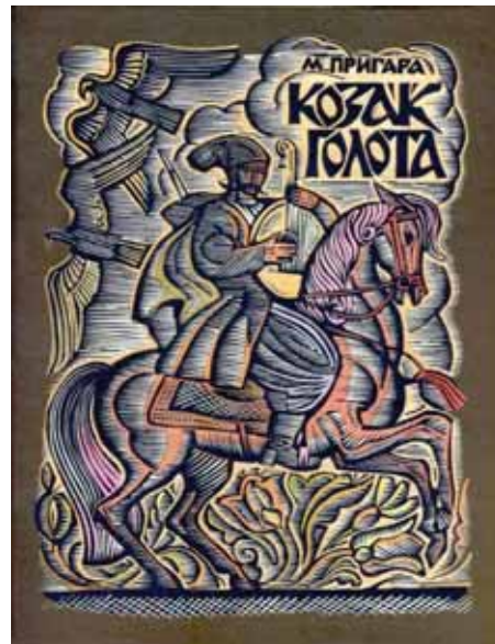
Г. Якутович. Козак Голота (обкладинка книжки)