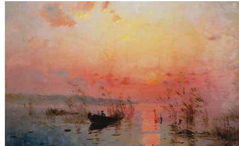
С. Васильківський. Захід сонця над озером

Яка картина виникла в уяві? Схарактеризуй мелодію, темп, динаміку. Порівняй пісню композитора зі своєю мелодією. Порівняй настрої пісні та картини. Що в них спільного?