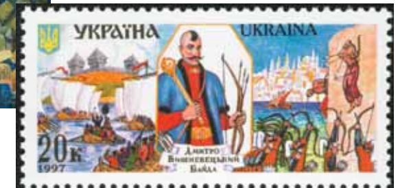
Поштова марка України «Дмитро Вишневецький Байда»