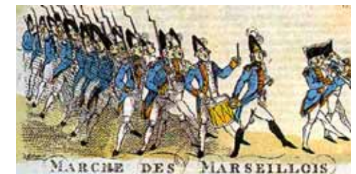
Ілюстрований фрагмент нот «Марсельєзи»

В історії музики існує безліч пісень урочистого характеру, серед яких — державні, військові, релігійні, революційні гімни. Так, відомий у всьому світі гімн «Марсельєза» створили повсталі французи під час буржуазної революції кінця 18 століття. Сьогодні цей твір є Державним Гімном Франції.