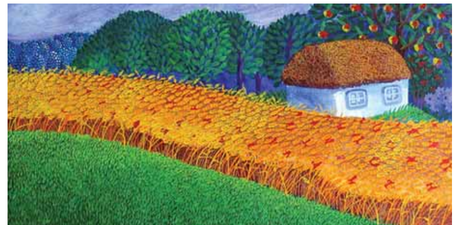
О. Кваша. Українське село (фрагмент)

Пісні, які співають під час жнив, коли збирають урожай, називаються жниварськими . Ці твори пов'язані з хліборобськими обрядами, адже жнива — найважливіший час літнього циклу. І хоча цей період життя людини характеризується важкою працею, він насамперед означає завершення хліборобського року. А чи відомо тобі, які обряди пов'язані зі жнивими? Якщо ні, тоді звернімося до народної скриньки.