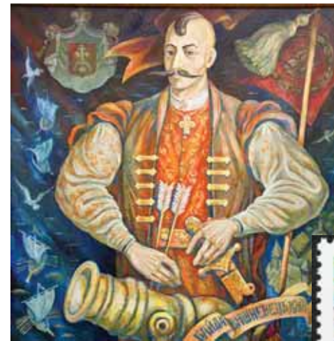
В. Форостецький Байда Вишневецький

Про Байду Вишневецького до нашого часу дійшла сила-силенна легенд і переказів! За переказами, якимось кримський хан Девлет-Гірей повів на Хортицю майже всю орду. Упродовж місяця тримали татари острів в облозі, але так і не змогли зламати опір козаків. Замість перемоги отримав кримський хан ганьбу та величезні втрати війська, тому й відступив.