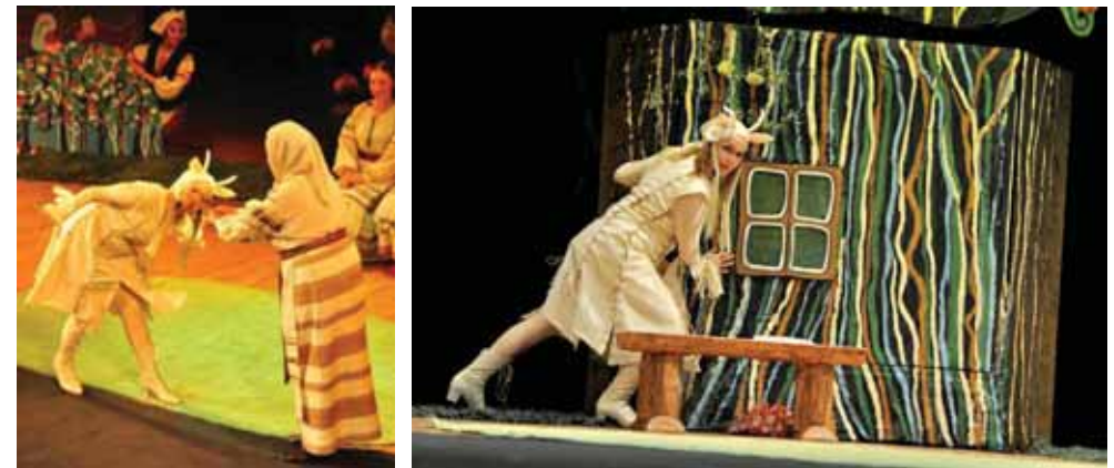
Фрагменти опери М. Лисенка «Коза-Дереза» (Волинський академічний обласний музично-драматичний театр імені Т. Г. Шевченка)

Жила-поживала вперта Коза. Ніхто не міг їй догодити: ані Бабуся, ані Дідусь. Розсердившись, Дідусь прогнав її з дому, і вирішила Коза оселитися в хаті Лисички. Як не намагалася руденька прогнати негідницю, однак марно... Звернулася тоді вона по допомогу до звірів, але й вони не змогли зарадити — залякала їх вередлива Коза-дереза. Лише хоробрий Рак-неборак зміг вигнати нахабу з хатки Лисички.