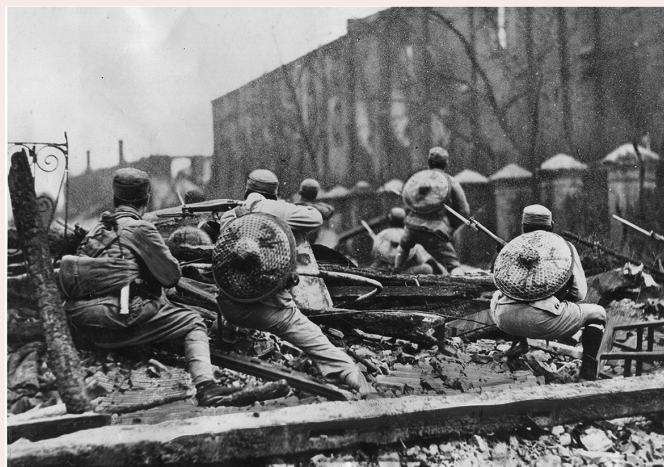
Збройна сутичка в Шанхаї, 1932 р., Китай