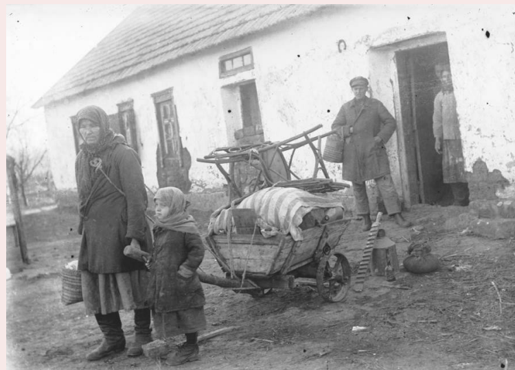
Розкуркулена сім'я біля свого будинку, Донецька область, 1932 р., Україна – СРСР