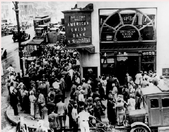
Голодні бунти в Детройті, 1932 р., США.